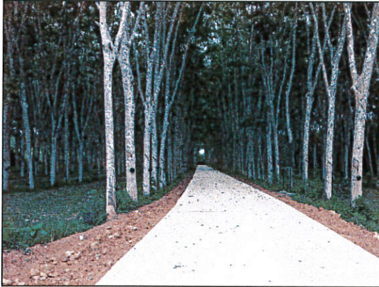
ซอยป่าเพียร (ต่อเนื่อง) หมู่ที่ 5