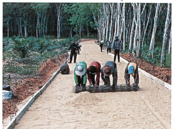
ซอยลิ้มทอง(ต่อเนื่อง) หมู่ที่ 1