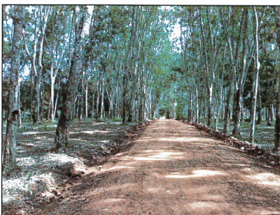
ปรับปรุงถนนสายขอนแก่น หมู่ที่ 2