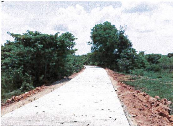
สายทุ่งนาเกษ (ต่อเนื่อง) หมู่ที่ 1