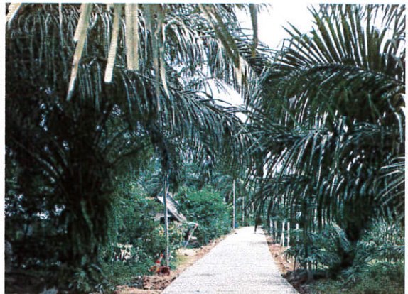
ซอยจักราพงษ์(ต่อเนื่อง) หมู่ที่ 3